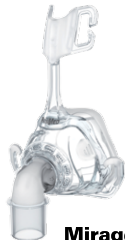
Mirage™ FX MASQUE NASAL